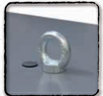
Ganci di sollevamento Lifting hookers