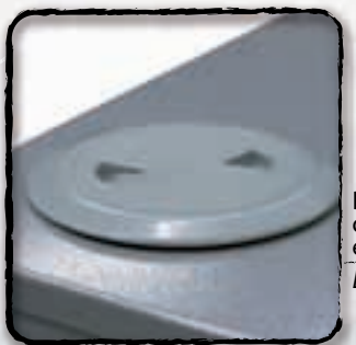
Bocchettone di rabbocco esterno External refill cap