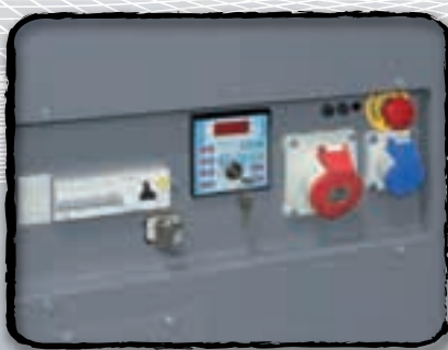
Pannello di controllo Control panel